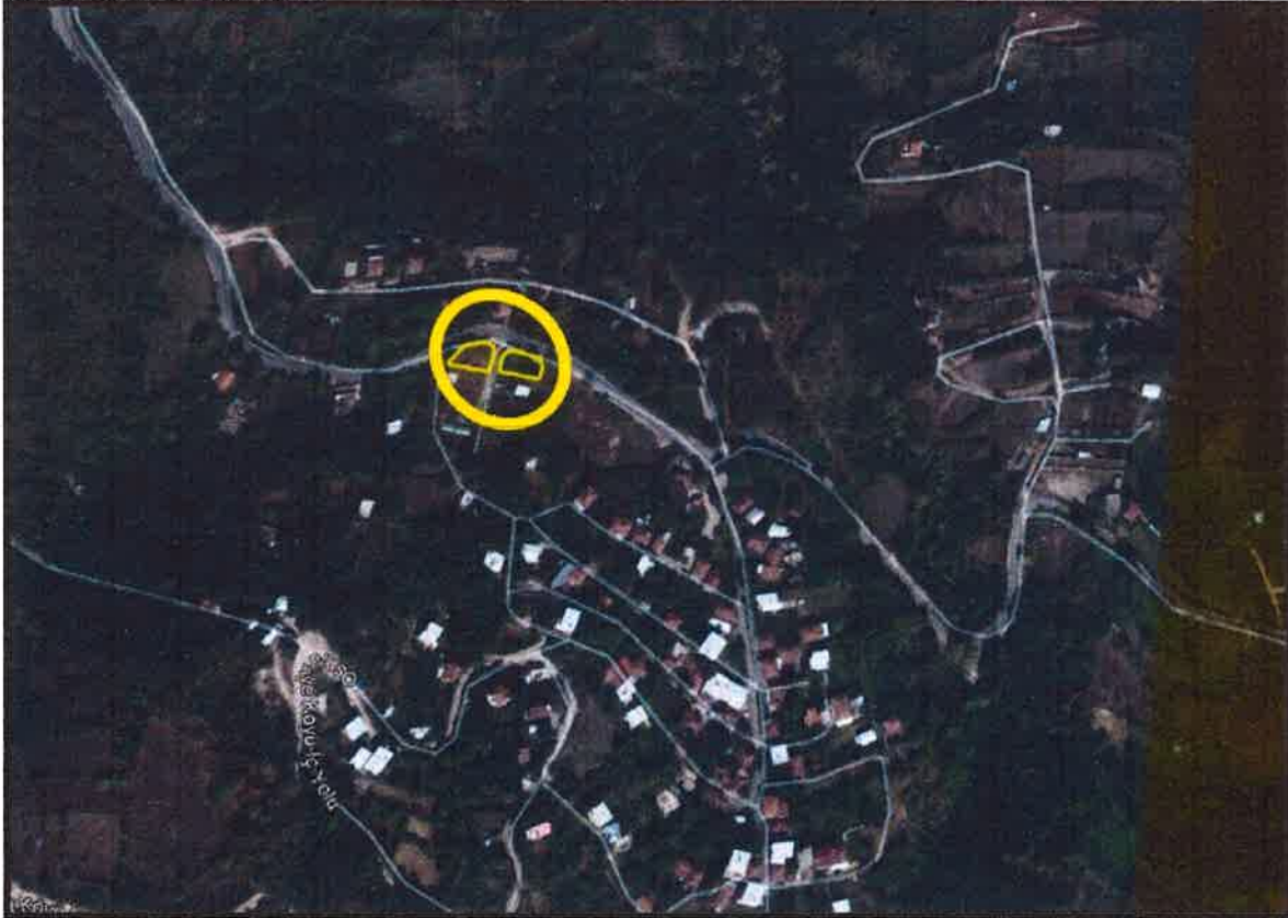
Şekil 1: Plan Değişikliğine Konu Alanın Konumu

Bursa İli, Kestel İlçesi, Osmaniye Mahallesi, 109-119 Ada, 19-5 Nolu Parseller; Osmaniye Mahalle merkezinin kuzeybatı yönünde konumlanmış olup, kuzey yönünde Osmaniye Köyü İçerisindeki Yoluna cepheli konumdadır.