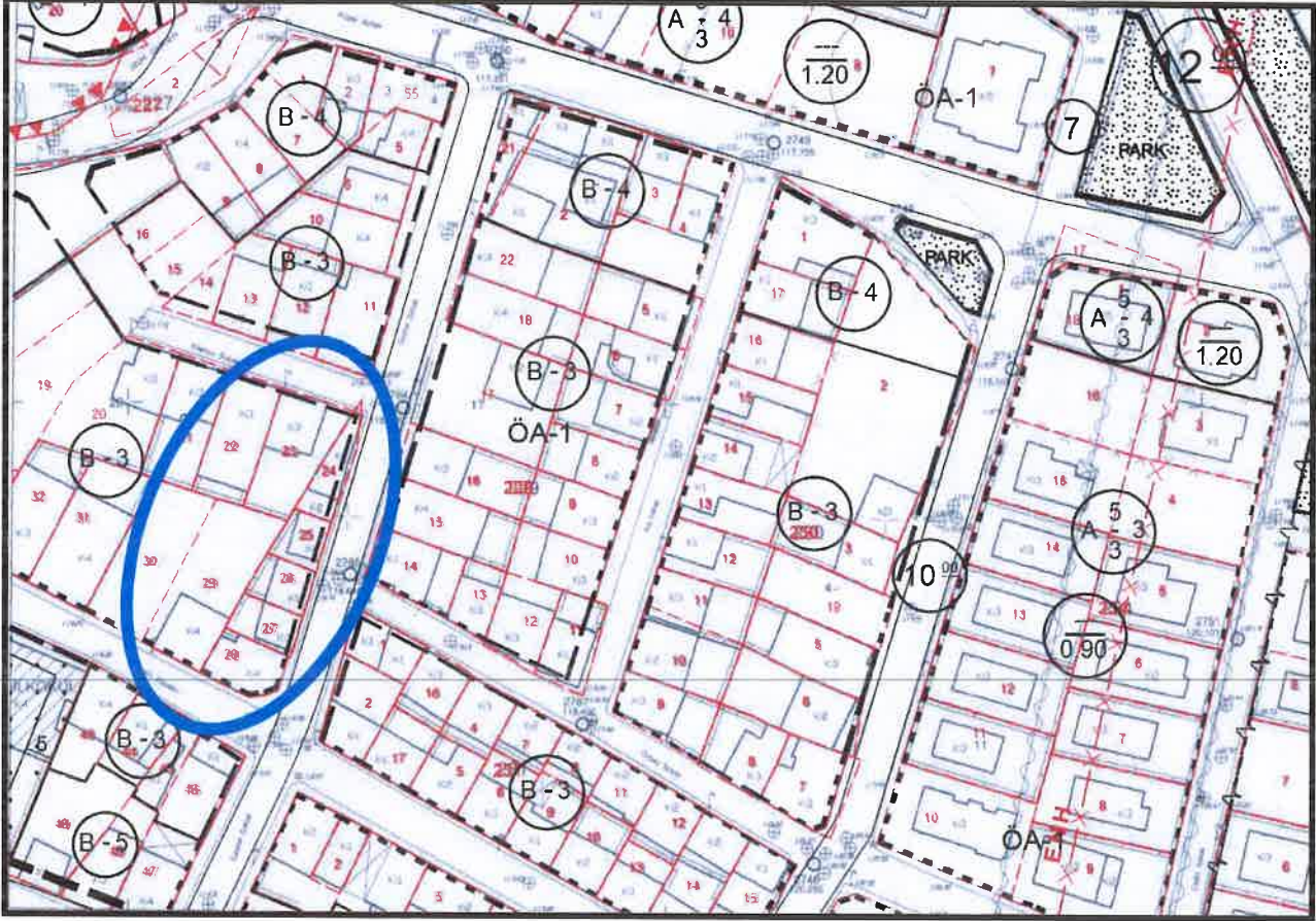
Şekil 2: Onaylı Plan Örneği

Söz konusu parseller; 1/1000 Ölçekli Kestel (Bursa) Revizyon Uygulama İmar Planında “Bitişik Düzen 3 Kat (B-3) Konut Alanı” olarak planlanmıştır.