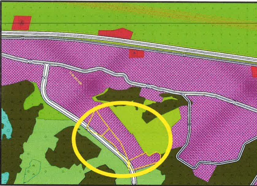
Şekil 3: Onaylı 1/5000 Ölçekli Plan Örneği

Onaylı 1/5000 Ölçekli Kestel Doğu Planlama Bölgesi Nazım İmar Planında söz konusu parsellerin bulunduğu alan "Sanayi Alanı" olarak planlanmıştır.