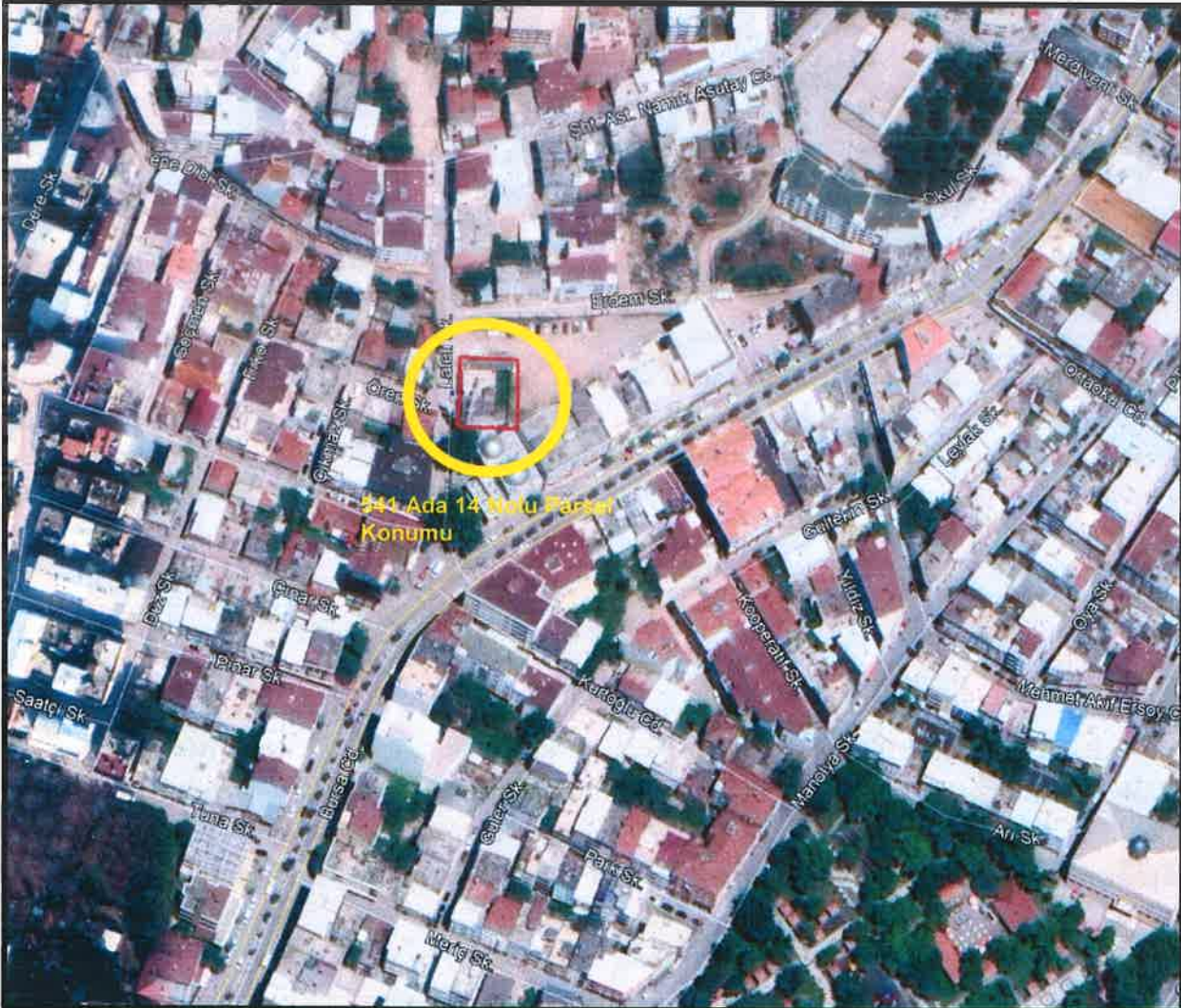
Şekil 1: 541 Ada, 14 Nolu Parsel Konumu

Bursa İli, Kestel İlçesi, Ahmet Vefik Paşa Mahallesi, 541 Ada, 14 Nolu Parsel, Bursa Caddesinin yaklaşık 25 metre kuzeyinde konumlanmış olup, güney yönünde Çınar Cami'ye komşu, batı yönünde ise Laleli Sokağa cephelidir.