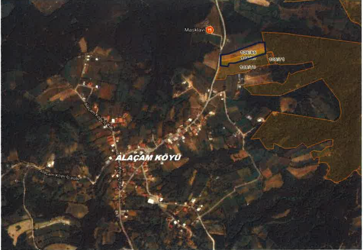
66-67 Parsel Hava Fotoğrafi

3-PLANLAMA BÖLGESİ: Plan değişikliği yapılan 106 Ada 66-67 parseller; Kestel İlçe merkezinin güney doğusu yönünde, Alaçam Mahallesi'ne 690 m, ilçe merkezine kuş uçuşu yaklaşık 10.5 km, Bursa İl Merkezine Kuş uçuşu 29 km mesafede yer almaktadır.