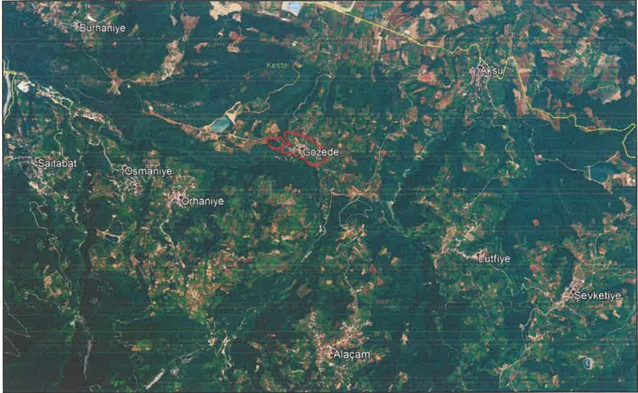
Şekil 1: Plan Değişikliğine Konu Alanın Konumu

Gözede Mahallesi'nin güneybatısında Orhaniye Mahallesi, güneyinde Alaçam Mahallesi, güneydoğusunda Lütfiye Mahallesi yer almaktadır.