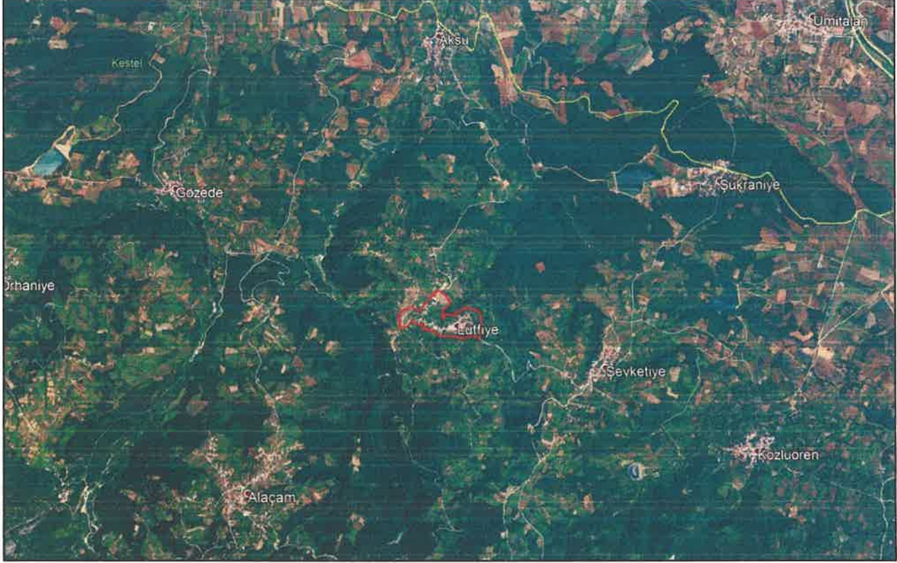
Şekil 1: Plan Değişikliğine Konu Alanın Konumu

Lütfiye Mahallesi'nin batısında Orhaniye Mahallesi, kuzeyinde Aksu Mahallesi, doğusunda Kozluören ve Şevketiye Mahalleleri ile kuzeydoğusunda Gözede Mahallesi yer almaktadır.