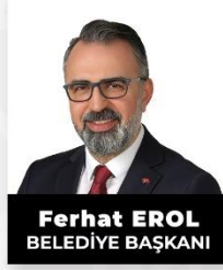
Ferhat EROL BELEDİYE BAŞKANI